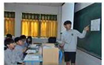
포레 진로코치단 1일 교사