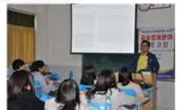
금융 분야 진로코칭