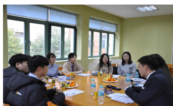
모의 면접 평가회