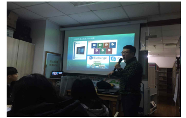
2018. 11. 21. 소프트웨어 분야