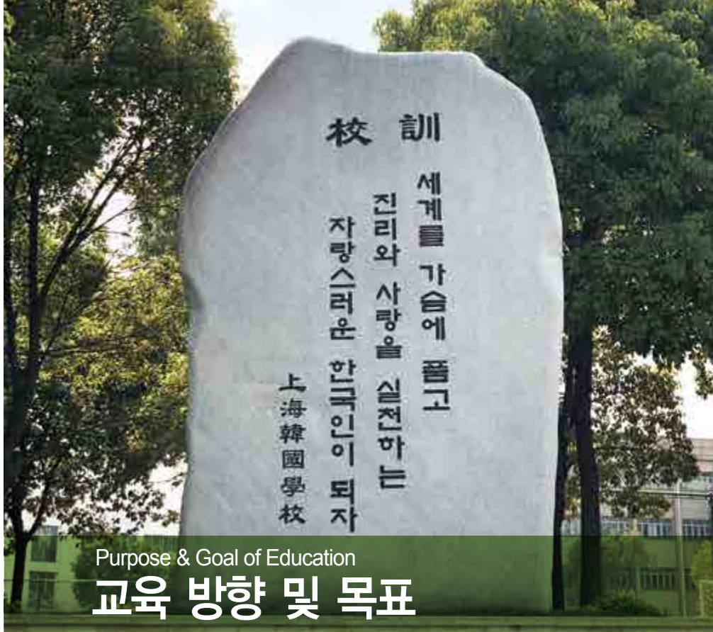
Purpose & Goal of Education