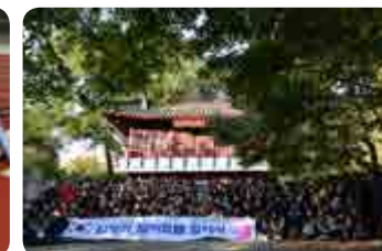
임정의 발자취를 찾아서