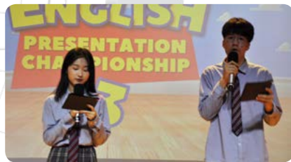
영어 프리젠테이션 챔피언십