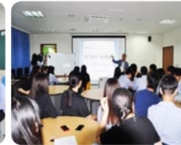
진로 인턴십 오리엔테이션