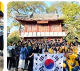
임정의 발자취를 찾아서