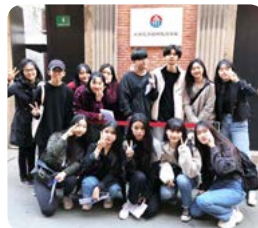
임정의 발자취를 찾아서