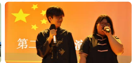
중국어 주제발표 대회