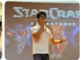
진로의 날 행사