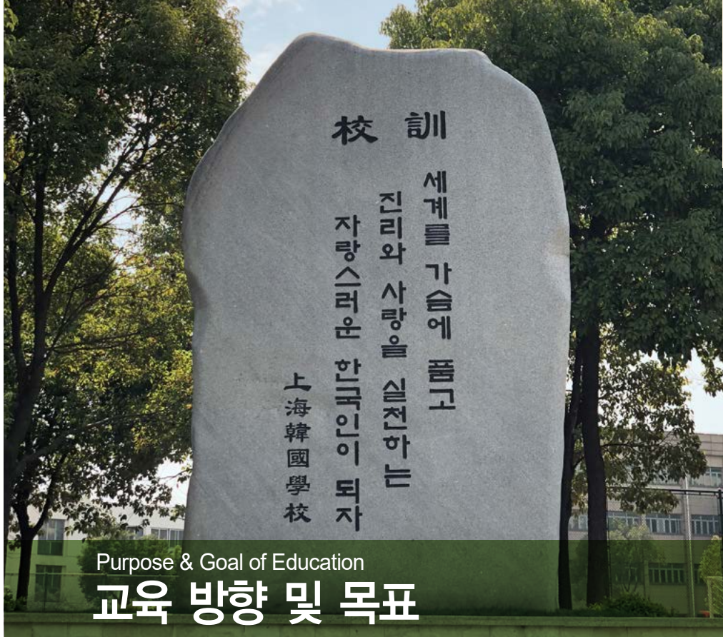
Purpose & Goal of Education