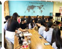
진로의 날 행사