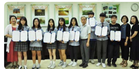
중국어 작문 실력발휘