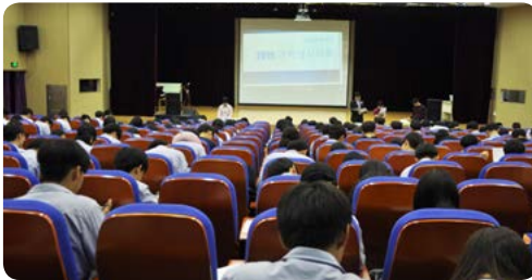
수학/과학의 날 행사