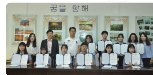
중국어 작문 대회