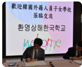
대만학교 MOU 체결