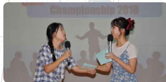
영어 프레젠테이션 대회