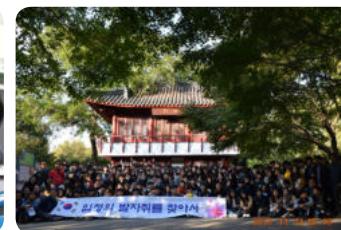
임정의 발자취를 찾아서