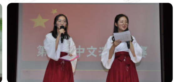
중국어 프레젠테이션 대회